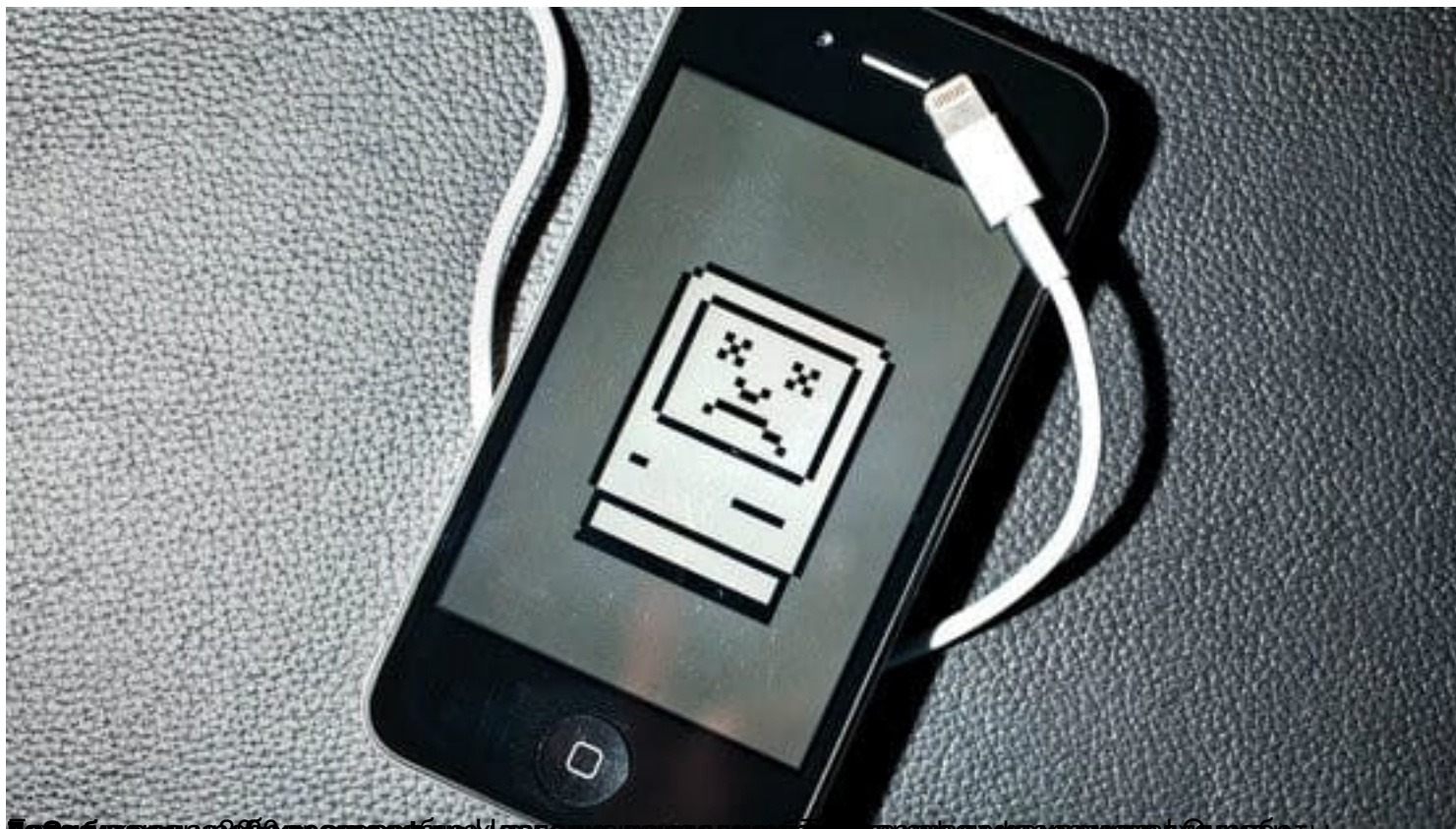
Некоторые пользователи предпочитают использовать оригинальный кабель Apple, который имеет более высокую стоимость, но и более высокую надежность.