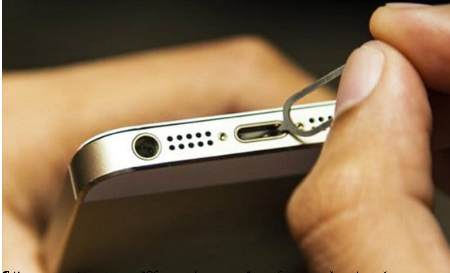
Для очистки контактов аккумулятора необходимо использовать мягкую ткань, например, ватный диск, и аккуратно протереть контакты, порт