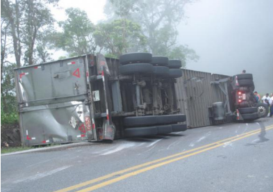
87 футов в высоту. Полностью разрушен. Управление автомобилем в условиях тумана и плохой видимости на дороге с деревьями