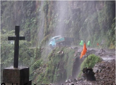
9000 футов в высоту, в Пуэрто-Рико, США. При строительстве в долине, которую называют