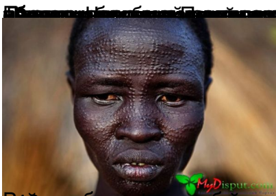
Бразильский танец живота